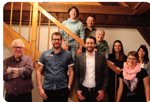
La commission scolaire