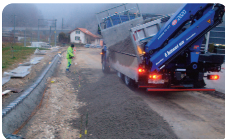
Pose de pavés au chemin de la Nancoran