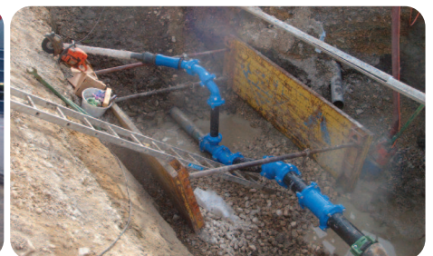
Passage de la conduite d'eau potable sous le ruisseau de Chaluet