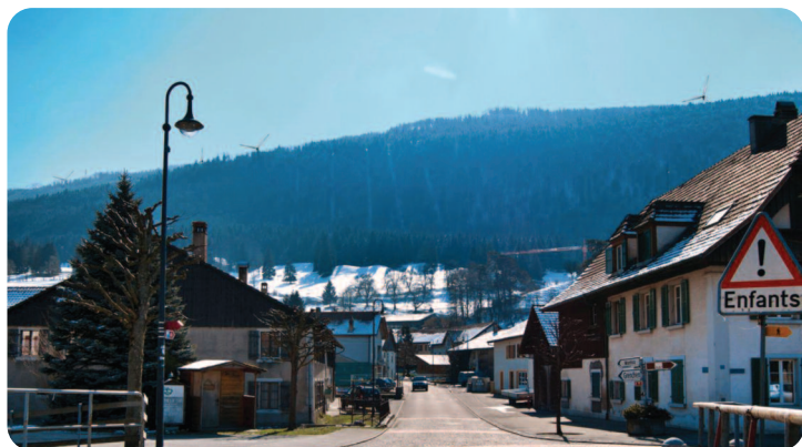
Aspect des futures éoliennes depuis le centre du village

En été 2016, un jalon important dans la longue histoire du parc éolien Montoz-Pré Richard fut posé avec la remise aux autorités compétentes en la matière du Plan de quartier ayant valeur de permis de construire. Les retours d'information sont très encourageants, ils ouvrent la voie, mais la route est encore longue jusqu'à l'implantation des éoliennes.