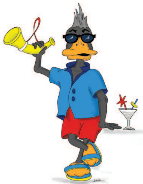
Nouveau logo de la fête du village, réalisé par Ludmila Beeler

Je profite de cet article pour remercier les bénévoles qui s'engagent pour offrir une très belle fête à tous les habitants. Merci également aux sociétés, qu'elles soient sportives, culturelles ou autres, pour leur engagement tout au long de l'année.