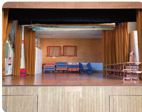
Les élèves et autres usagers n'auront plus à descendre le matériel de sport depuis la scène.

Daniel Bueche Conseiller municipal en charge du dicastère des infrastructures