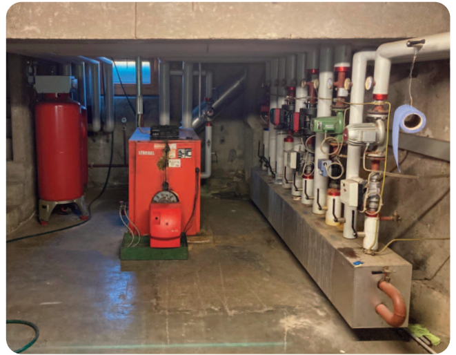
Chauffage actuel de la halle de gymnastique et des écoles

sont des frais d'architecte, y compris la part de l'ingénieur. Cette somme permettra l'élaboration de plans, le calcul des coûts et les démarches en vue de l'obtention des permis de construire. 40'000 francs (dont à déduire un éventuel subventionnement du canton à hauteur de 50 %) sont dédiés à l'avant-projet du chauffage à distance. Cette étude ne comprend pas seulement le remplacement des installations actuelles des bâtiments communaux, mais aussi l'élargissement du chauffage à des privés dans les quartiers avoisinants et l'intégration de panneaux solaires ou d'autres formes d'énergie renouvelable. Ce projet doit viser à économiser l'énergie dans le cadre d'une utilisation raisonnée de ressources locales. Le fait d'étudier ces différentes variantes, ainsi que l'ouverture aux privés sera une bonne carte de visite pour notre village dans cette période de transition énergétique. 20'000 francs est la somme prévue pour les émoluments et taxes inhérents aux deux permis de construire (chauffage à distance et agrandissement, rénovation de la halle). 20'000 francs sont des frais de géomètre, de notaire, de radiation et de création de droits de passage, et les derniers 20'000 francs, soit le 10 % de la somme totale sont des divers et imprévus.