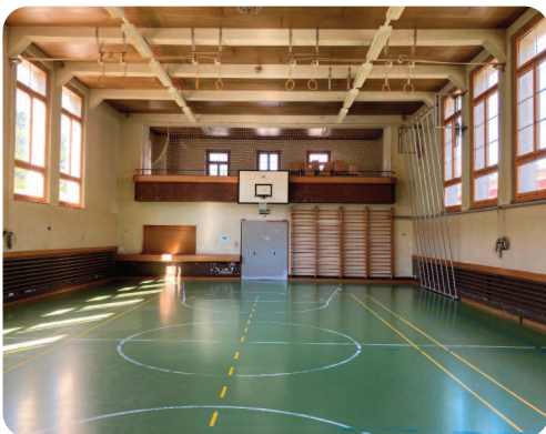
Halle de gymnastique

Notre population et les élèves de nos écoles méritent de disposer d'infrastructures dignes de ce nom. Vu l'état du bâtiment et vu la transition énergétique, le temps n'est plus à la tergiversation mais à la réalisation.