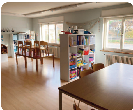
Nouveaux locaux pour l'enseignement individualisé

En ce qui concerne la rénovation et l'agrandissement de la halle de gymnastique, ainsi que la construction d'un chauffage unique pour le centre communal, la halle de gymnastique et les deux bâtiments scolaires, un avant-projet a été établi et présenté au Conseil municipal. Des informations complémentaires à la population feront l'objet d'un thème spécifique dans le prochain journal communal. Idéalement, une votation par la population du crédit nécessaire à cet agrandissement et à cette rénovation devrait avoir lieu dans le courant de l'année 2021.