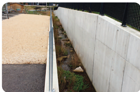
Aménagement en faveur de la biodiversité dans le canal en béton.