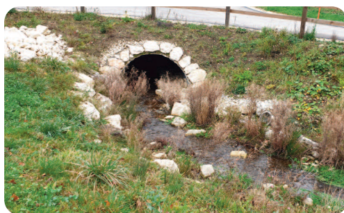
Une buse métallique a été posée sous la route (longueur : 24 m ; hauteur : 1.6 m) avec aménagement à l'intérieur pour favoriser la biodiversité.