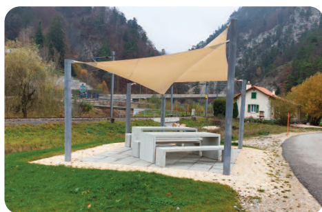
Une place de détente a été aménagée pour permettre de prendre l'air durant les beaux jours.

Conseiller municipal en charge du dicastère de l'environnement