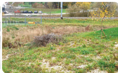
Trois arbres fruitiers ont été plantés et des aménagements en faveur de la biodiversité ont été réalisés.