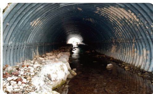
Vue de l'intérieur de la buse.