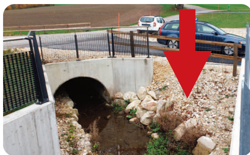
À l'emplacement de la flèche rouge sera aménagé un canal de déviation de la Birse (utile en cas de crues).