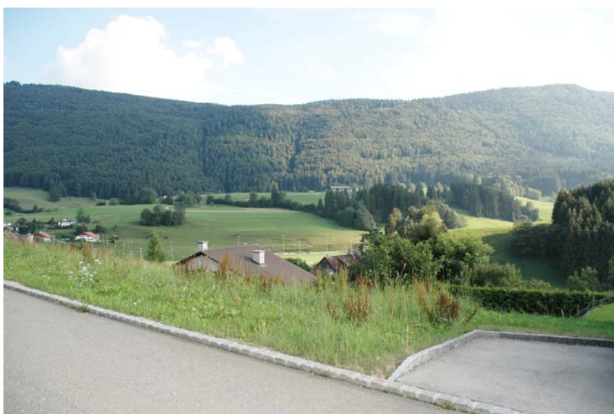
Vue de la parcelle