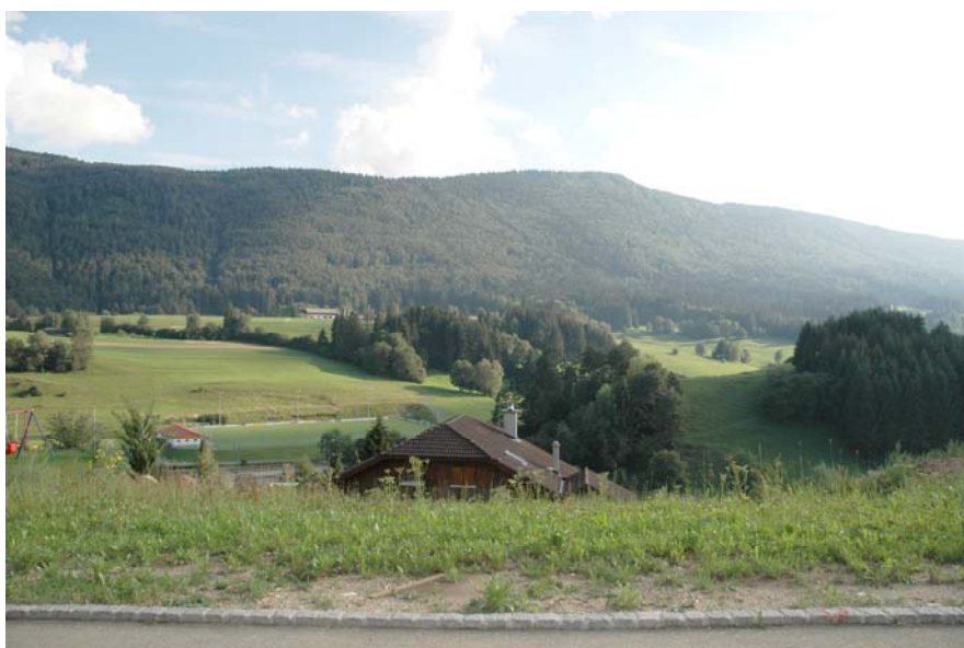
Parcelle : plein sud. Vue sur le terrain de football et la Birse