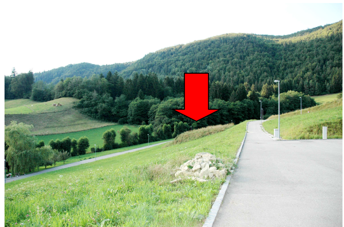
Vue vers l'est en direction de la parcelle.