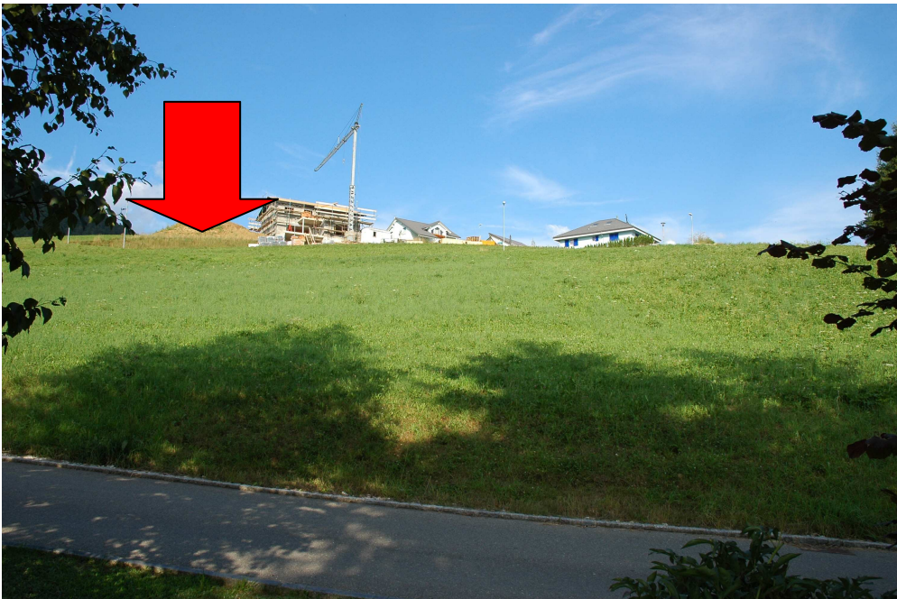
Vue de la parcelle depuis l'ouest.